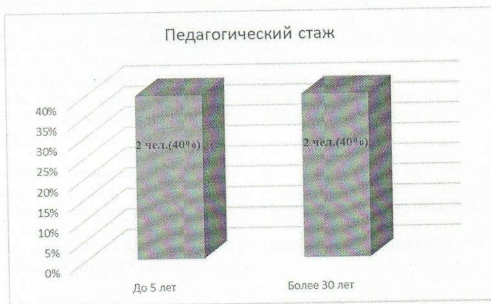
Рис.3 Педагогический стаж работников

методических объединений, применение новых методов и приемов, соответствующих для первой квалификационной категории.