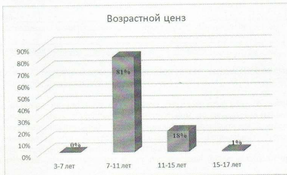
Рис.1 Возрастной ценз обучающихся

В рамках Федеральных проектов «Культура для школьников» и «Пушкинская карта» с обучающимися и воспитанниками из учреждений: детский сад № 13, школа № 26, школа № 48, школа – интернат № 6 проводились мастер-классы по гончарному делу, эпоксидной смоле и изделий из фоамирана.